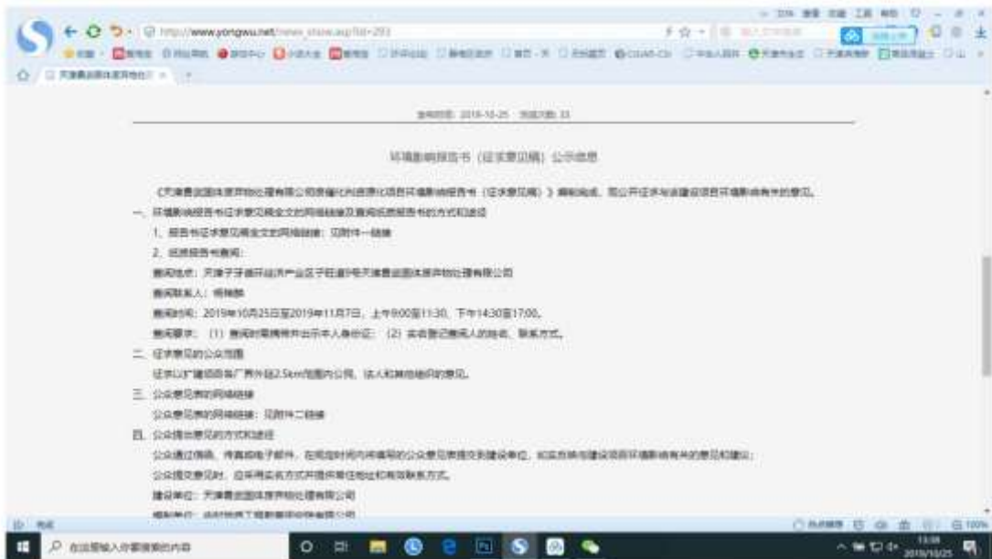
图2 第二次网上公示信息截图