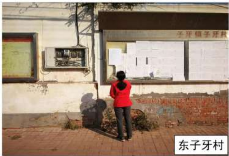
图5 现状张贴公示照片