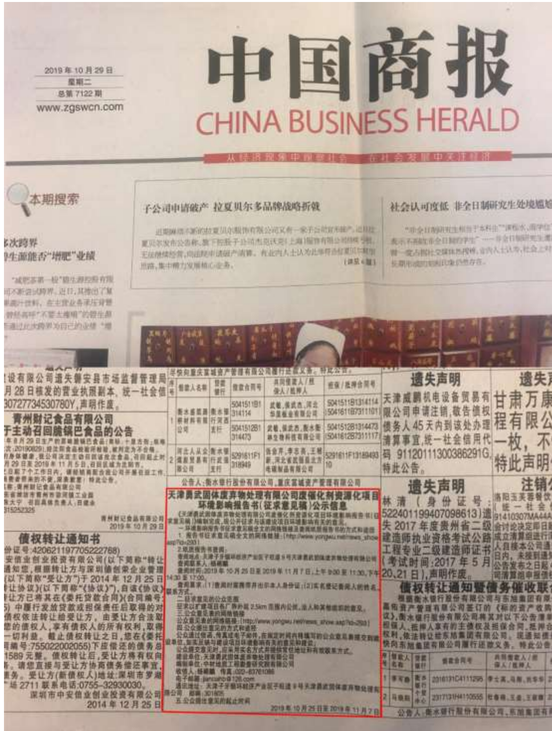
图3 2019年10月29日报纸公示